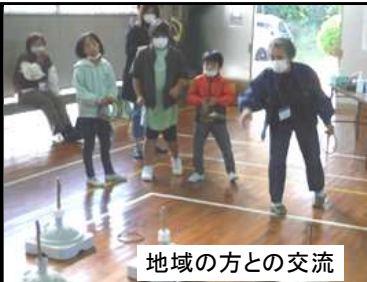
地域の方との交流