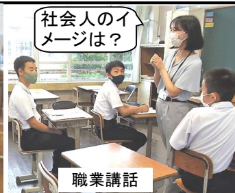
社会人のイメージは？ 職業講話