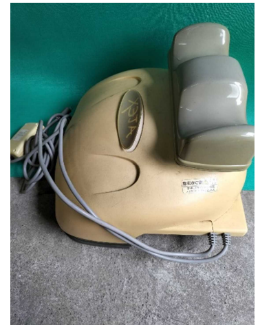
健康器具(マッサージ器など)