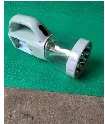
懐中電灯(プラスチック製のもの)