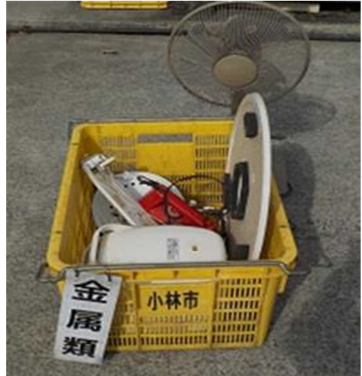
電気コードが 付いているもの

☆ 直接、黄色のコンテナに入れる。(袋に入れて持ってきた場合、袋から出して入れる。)