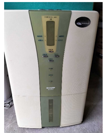
加湿器・除湿機・空気清浄機