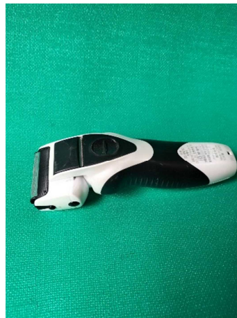
バリカン・シェイバー