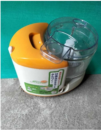
ジュースー・ミキサー