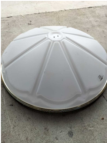
蛍光灯のかさ(ガラス・プラスチック製)