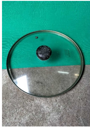
鍋のふた(耐熱ガラス)