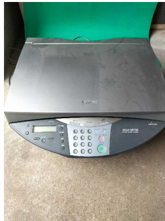
スキャナー・複合プリンター(家庭用)