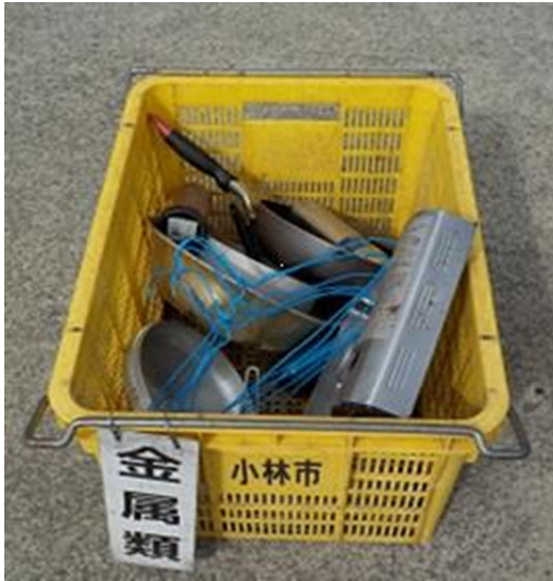
電気コードが 付いていないもの

☆ 電気コードが 付いているもの と、 付いていないもの は、 分けてコンテナに入れる 。