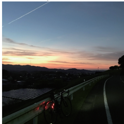
#運動公園 #朝の風景