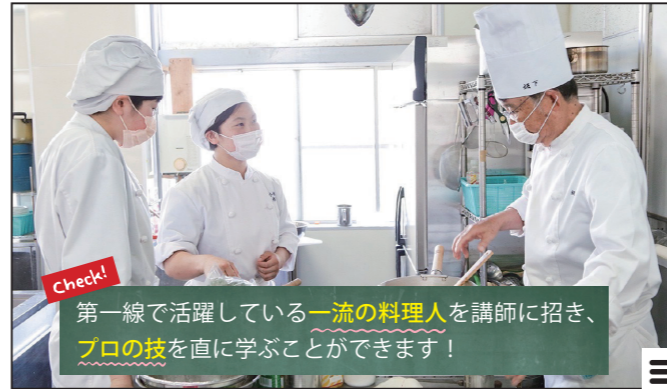
Check! 第一線で活躍している一流の料理人を講師に招き、プロの技を直に学ぶことができます!