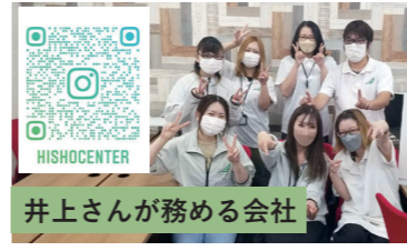
秘書センター(株) 宮崎支社 創業 平成28年 従業員30人 募集業種 オペレーター(フルタイム、パート)