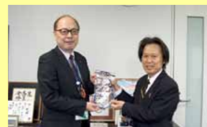
3月28日、小林ライオンズクラブより自転車用ワイヤーロック錠