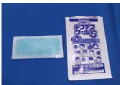
「貼付けタイプの冷却剤」 (答えは左のページ)