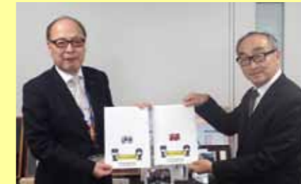
3月24日、西諸小林地区危険物安全協会より防災啓発クリアファイル