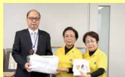
3月29日、市地域婦人連絡協議会より安全祈願のかえるのお守りと雑巾