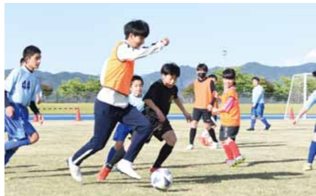
この教室は、市と健康増進に関する連携協定を結んでいる明治安田生命保険相互会社協力のもと実現されました