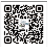
QRコードから申込みできます

申込方法・申込先 左のQRコードから申込みか、小林市社会福祉協議会へ電話で申込みください。