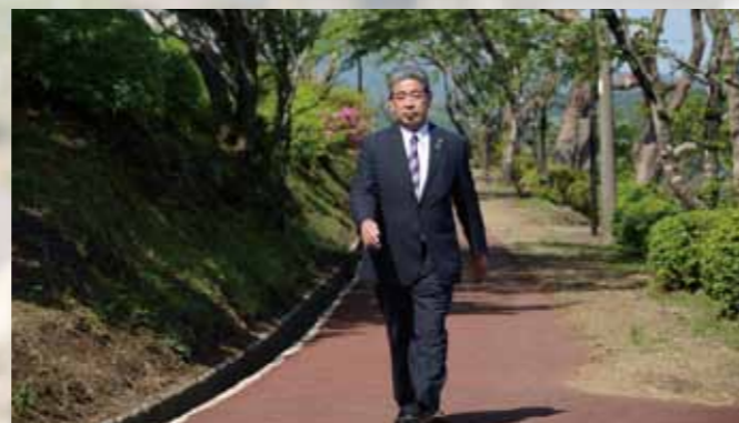
永田平公園にウォーキングコースを整備しました。コロナ禍の健康対策として、ウォーキングをはじめませんか。

「対話と決断」で持続可能なまちへ まちづくりは、10年後、20年後、さらにその先を見据えた持続可能なものである必要があります。市民の皆さまが元気に笑顔で暮らし続けられる小林市であるために、市民の皆さまとの対話を重ね、決断する市政運営を図ってまいりますので、ご理解とご協力を賜りますようお願いいたします。