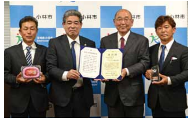
マンゴー部会は、ネット販売などニーズに合わせた販売にも取り組むなど、コロナ禍に対応しながら、質のよいマンゴーの生産・販売に力を入れています

3月27日、県内初のプロサッカーチームとなったテゲバジャーロ宮崎の選手を招いてサッカー教室が開催されました。教室には、市内の小・中学生約80人が参加。鬼ごっこを用いた基本的動作の練習やゲーム形式の練習によりプロの指導を受けました。子どもたちは普段目にかかることのないプロ選手の高い技術力を間近で体感しました。