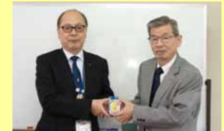
3月25日、西諸地区生コンクリート事業協同組合より防犯ブザー