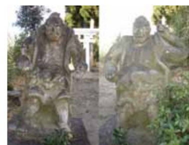
▲写真上段：㊸仲間の田の神、㊹南島田の田の神、㊺中孝の子の田の神 写真下段：八王子神社仁王像

2022年から300年前といえ、1722年の享保7年です。この享保7年には、小林市で多くの石像物が造られ今も現存しています。東方の陰陽石に向かう道沿いに佇む「仲間の田の神」、細野字島田前の県道沿いに佇む「南島田の田の神」、南西方孝の子地区の公民館隣に佇む「中孝の子の田の神」、真方字杉藪の八王子神社の入口に佇む「八王子神社仁王像」です。