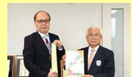
4月14日、小林地区交通安全協会と県交通安全協会より反射タスキと下敷き