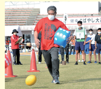
地区対抗型から自由参加型に変更した健幸こぼやし大運動会

さまざまな種目を通じて、多くの皆さんとのふれあいを楽しみにしております。 楽しく体を動かし健康になることで、元氣と笑顔が生まれます。 運動の秋、健幸づくりの秋を、みんなで楽しみましょう。