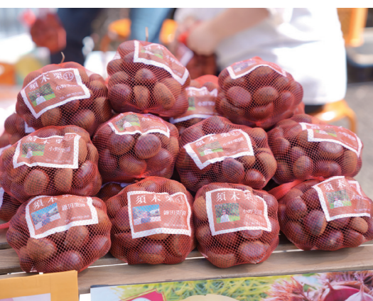
大粒サイズで艶やかな須木栗