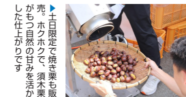
十日限定で焼き栗も販売。ホクホクで、須木栗がもつ自然の甘みを活かした仕上がりです。