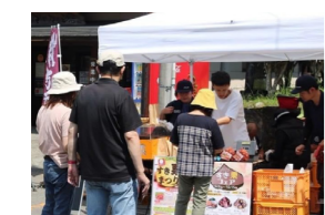
須木栗フェアの様子。市内外から須木栗を買い求める人々で盛況