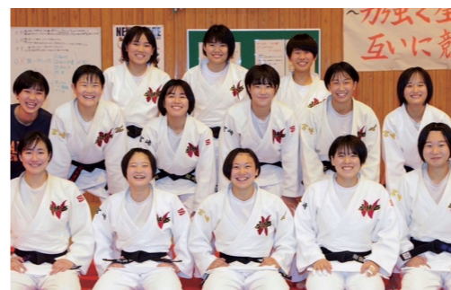
県大会で例年上位に名を連ねる県内トップレベルの競技力を誇る小林西高柔道部