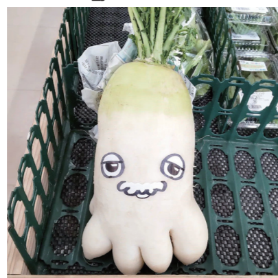
#おもしろ大根 #百笑村