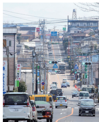
#真方と細野の境目