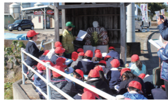
▲上段：文化財巡りウォークラリー、中段：協会内部学習会、下段：小学校地域学習

小林市には数多くの文化財が存在します。今回は、文化財そのものではなく、小林市の文化財を広く皆さんに知ってもらうため、日々学習し、文化財を案内・解説する活動をしている団体、小林市ガイドボランティア協会をご紹介します。 小林市ガイドボランティア協会は、市内の文化財（歴史・自然・風土）について児童生徒や市内の皆さんに対してガイドを行っている団体です。平成20年2月に発足しました。 多くの人に郷土の歴史に愛着と関心を深めていただけるよう、公民館歴史講座や文化財巡りウォークラリーなど、さまざまな取り組みを行っています。 市内の歴史やガイド手法について月一回程度の定期学習会も開催していますので、今から歴史を学ぼうと考えている人も安心して参加できます。 1人でゆっくり文化財を見て回るのも良いですが、詳しい人に説明してもらいながら文化財を見て回るのも新しい発見があつて面白いと思います。ふるさとの歴史に興味がある人、詳しく知りたい人、仲間と一緒に楽しく学びたい人は、ぜひご参加、ご利用ください。