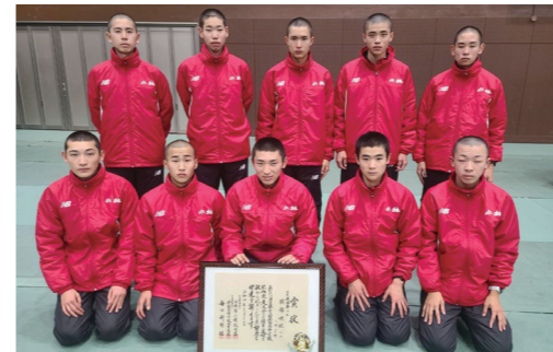
県大会では7人全員が区間賞を独占し、全国で最も多い58回目の都大路出場を果たした駅伝部