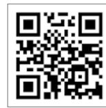
▲宮崎県ふるさと就職説明会専用サイト

説明会参加企業のうち約20社 ※参加企業などは専用サイト 「宮崎県ふるさと就職説明会ONLINE LIVE」に掲載