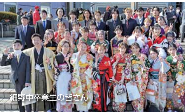
細野中卒業生の皆さん