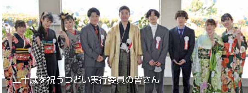
二十歳を祝うつどい実行委員の皆さん