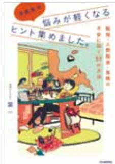
『中高生の悩みが軽くなる ヒント集めました。』 著者：葉一 発行：河出書房新社