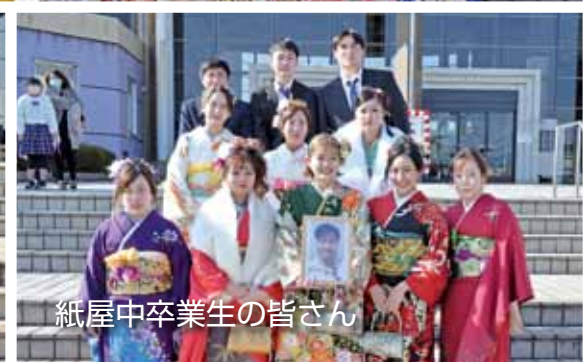
紙屋中卒業生の皆さん