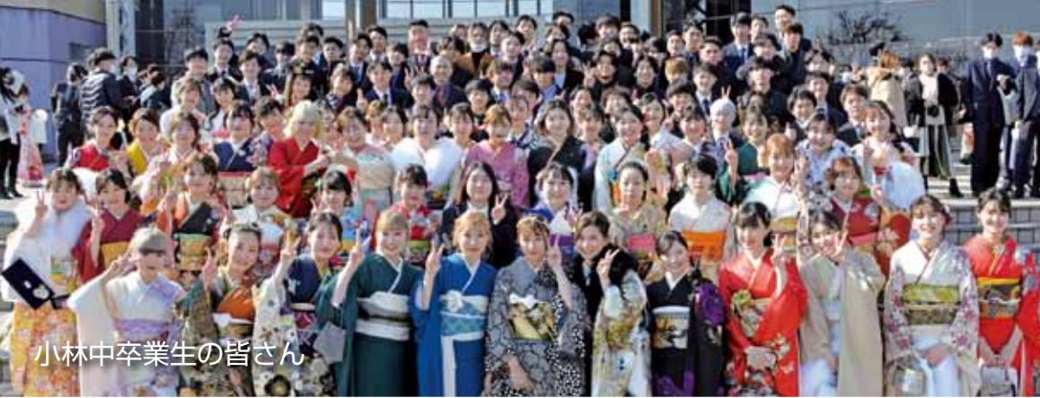
小林中卒業生の皆さん