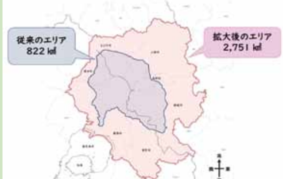
【図】従来のエリアと拡大後のエリアの比較