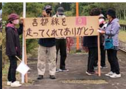
小林駅や西小林駅で豪華寝台列車「ななつ星in九州」を出迎える沿線住民や児童・生徒。ななつ星in九州は令和4年10月～12月にかけて吉都線内を運行。吉都線に初入線した10月20日には、約600人が小林駅横の中央ふれあい広場に集まり、小旗やバルーンなどを持って列車を歓迎しました。