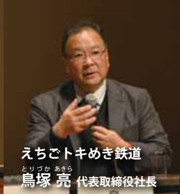
えちごトキめき鉄道