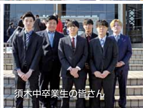
須木中卒業生の皆さん