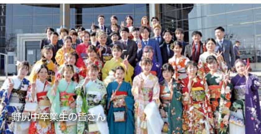
野尻中卒業生の皆さん