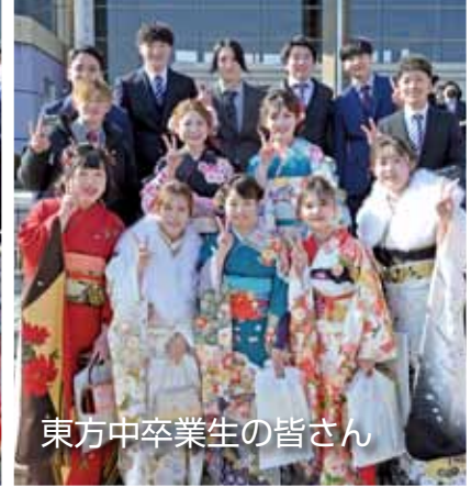
東方中卒業生の皆さん