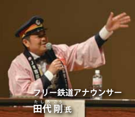
フリー鉄道アナウンサー