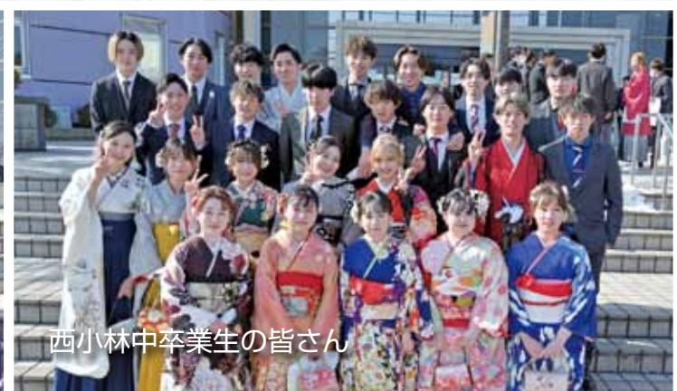
西小林中卒業生の皆さん