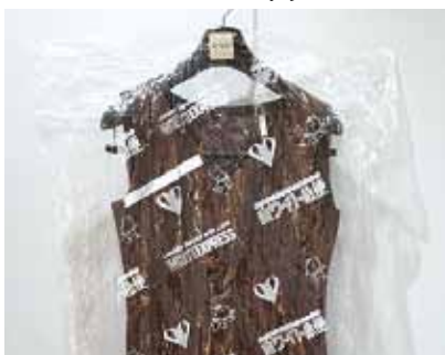
「クリーニングのポリ袋の出し方」 (答えは左のページ)