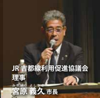
JR 吉都線利用促進協議会 理事