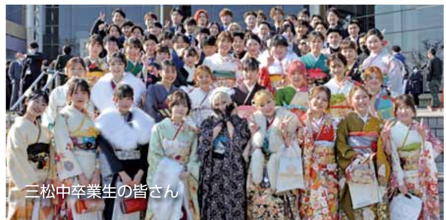
三松中卒業生の皆さん