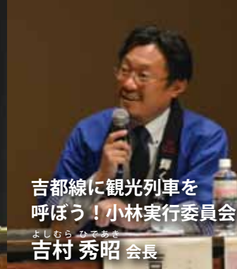
吉都線に観光列車を 呼ぼう！小林実行委員会