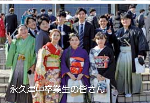
永久津中卒業生の皆さん