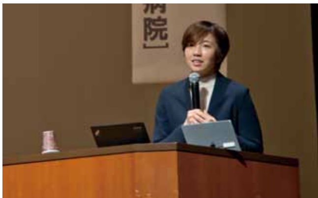
講演会は小林高校、小林秀峰高校、小林西高校の高校生 17 人からなる実行委員会が企画・運営。当日の司会進行や受付、駐車場整理なども行いました