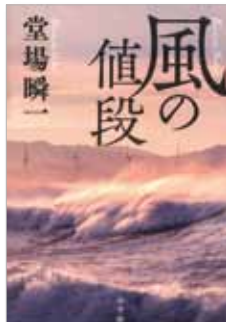
『風の値段』 著者：堂場 瞬一 発行：小学館