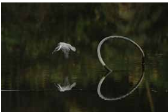
# 出の山公園 # ハートでジャンプ