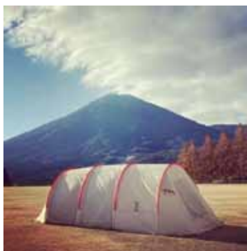
# 生駒高原 # キャンプ