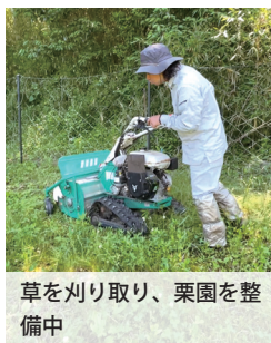
草を刈り取り、栗園を整備中

去年は「教えてもらおう」ことで精一杯だった自分も、今年は少しずつ、自分なりに考えながら栗園と向き合うようになりました。秋に「美味しい」と感じてもらえる栗は、こうした春の積み重ねの中で育っています。今年も栗園で、一つひとつ向き合っていきたいと思っています。