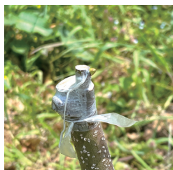
接木した若木。専用テープで接合部を保護