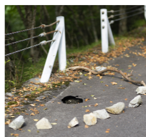
●問＝建設課 Tel 23-0311