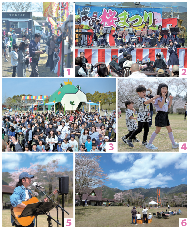
Photo 1・2 ステージイベントやさくら市でにぎわうまきばの桜まつり 3・4 せんぐまきやケロリンピックで笑顔溢れるのじりこびあの桜まつり 5・6 桜の下、音楽とあそびをテーマに開催されたすきむらんどさくらフェスタ

4月5日、すきむらんどで「さくらフェスタ 2026」が開催されました。まつりは、手ぶらBBQやフードトラック、子ども縁日などの催しを実施。来場者は、桜に囲まれた広場で食を満喫しながら音楽に触れ、春のひとときを楽しんでいました。