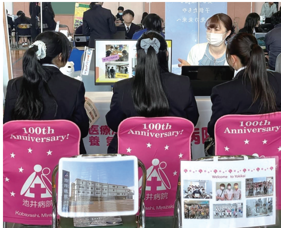
#池井病院 #就職フェア