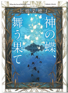
『神の蝶、舞う果て』 著者：上橋 菜穂子 発行：講談社