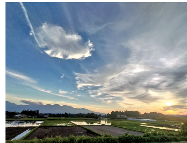
#東方 #夕日 #新燃岳