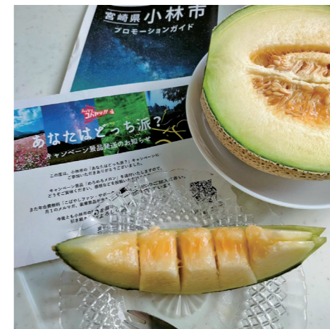
#あなたはどっち派キャンペーン