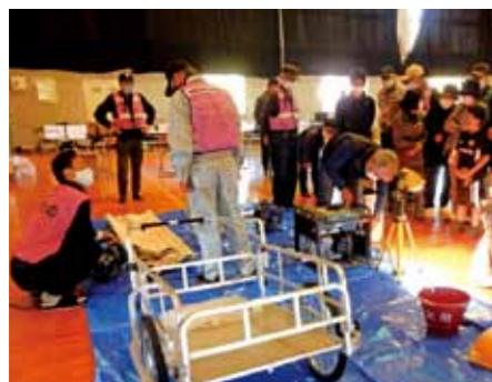
昨年の防災訓練の様子。訓練当日は訓練に参加された方への炊き出しなども準備されます

今後発生が想定される南海トラフ地震や内陸型地震などに備え、地区住民の防災意識向上を目的に、防災訓練を実施します。ぜひ参加ください。 ◆日時 9月23日(土曜) 8時30分～ ◆場所 細野地区体育館 ◆対象 細野地区住民 ※細野1区～3区の住民 ◆内容 8時30分に防災ラジオで避難を呼びかけますので、指定避難所である細野地区体育館に避難してください。 避難訓練後、AEDの使用方や災害現場映像の鑑賞、火災発生時の消火訓練、バケツリレーを実施予定です。