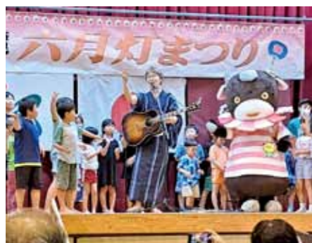
▲こばやしの人とまちが輝く！元気と笑顔ハッシン事業補助金を活用して開催しました