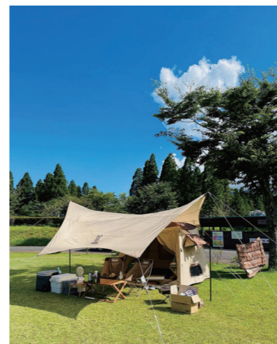
#ロケ地巡礼 #ひなもり台