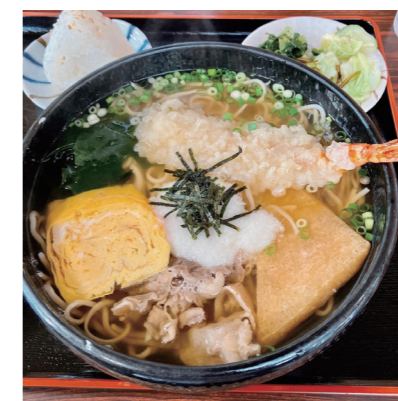
#小林市グルメ #蕎麦