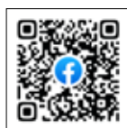
にっこば まちづくり協議会

きずな協働体では、SNSで行事予定や活動状況など、身近な地域の話やまちの魅力を発信しています。ぜひ、お住まいの地域のアカウントを登録ください。