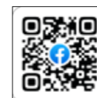
細野 まちづくり協議会