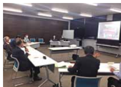
活動報告会の様子

3月20日、令和4年度に事業に取り組んだ市民団体の活動報告会を開催しました。「元気なまちづくり支援事業」は、市民活動団体に対し、活動段階に応じた支援を行うもの。「NPOパートナーシップ創造事業」は、市民や行政、市民団体と協働して事業を実施すること、小林市の魅力と活力ある地域社会の実現を目指す取り組みを支援するものです。報告会では、選考委員や協働した課、他の団体が見守る中、各団体の取組内容や事業効果について発表があり、次年度に向けた取組方法や他団体との連携など今後の活動につながる活発な意見交換が行われました。各団体の取組内容は、市ホームページで紹介していますので、ぜひご覧ください。