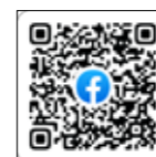
南校区 まちづくり協議会