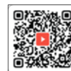
永久津 いきいき協議会