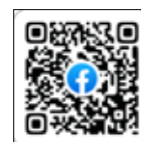
すき むらづくり協議会