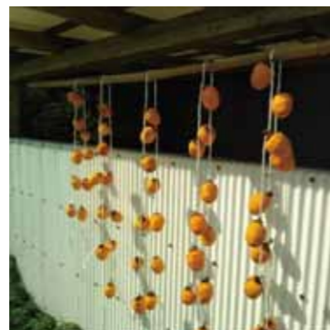
#いなかぐらし #干し柿