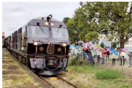
#ななつ星 in 九州 #豪華寝台列車 #吉都線