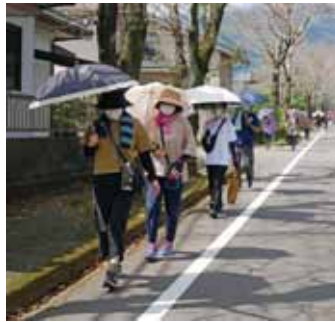
こばやしの人とまちが輝く！元気と笑顔創出事業費補助金を活用しています