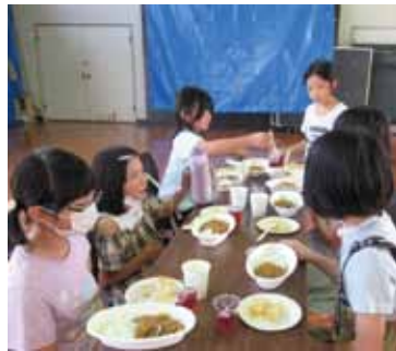
にっこばふれあい食堂の様子。みんなで食べるとおいしいね！

西小林地区公民館で、偶数月の第一土曜日に「にっこばふれあい食堂」を開催しています。10月のメニューは、カレーライス、サツマイモとリンゴの揚げ餃子、フルーツゼリーでした。ガスで炊いたごはんもおいしいと評判です。食後はバドミントンをしたり、外でボール遊びをしたり、楽しい時間を過ごせました。また来てね！