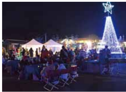
⑭イルミナクリスマス (小林まちづくり株式会社)