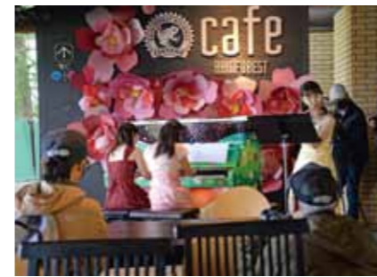
⑤ストリートピアノお披露目コンサート (ストリートピアノでまちに音楽を奏でる会)