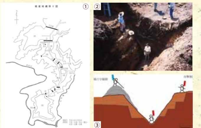
▲①紙屋城縄張り図(野尻町史より)、②紙屋城第2の空堀跡(昭和62年調査時)、③紙屋城空堀掘削式図

薬研堀であることが確認され、紙屋城の高い防衛機能を示す貴重な文化財として小林市指定史跡となっています。現在、紙屋城跡のほとんどが民有地ですが、各所に空堀跡や土塁などの痕跡を見ることができます。