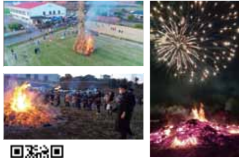
南校区まちづくり協議会の YouTubeでイベントの様子を紹介