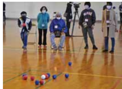
⑱国際交流ポッチャ大会 (小林市民から元気をもらおう会)