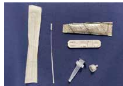
「コロナウイルス抗原検査キット」 (答えは左のページ)