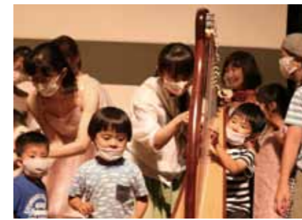
⑨ハーブとおはなしを楽しもう (南小学校読みきかせサークルたんぼぼ)