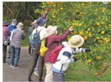
⑮須木の秋のあじわい“フットパス”！ (霧島おむすび自然学校)