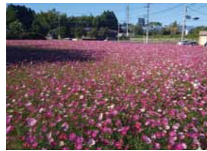
⑫にっこばコスモスプロジェクト (にっこばまちづくり協議会)