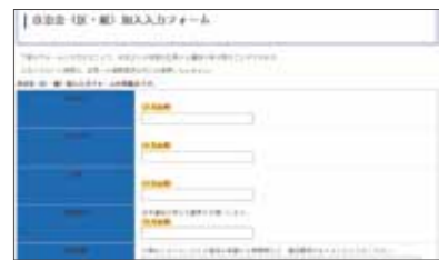
市ホームページから 区・組への加入申込ができます

3月～4月は自治会（区・組）加入促進月間です 自治会（区・組）とは、同じ地域の住民が自主的に運営し、お互いの助け合いの心から生まれた最も身近な組織です。日頃の活動や交流を通じて連帯感を深め、共通の課題をみんなで協力して解決する役割も担っています。 加入方法や区費・組費などで分からないことがありましたら最寄の区長・組長にご相談ください。不明な点は、企画政策課まで問い合わせください。区・組への加入をお願いします。