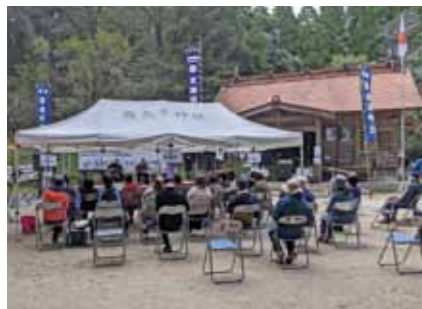
③元気と笑顔！きばっどコンサート♪ (こばやし音楽のまちづくり実行委員会)