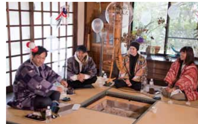
さまざまな経歴を持つパネリストが、「西諸に移住した理由」や「西諸での仕事」、「西諸の好きな場所・モノ・人」について語り合いました