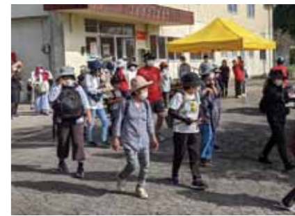
⑩永久津いきいきウォーキング大会 (永久津いきいき協議会)