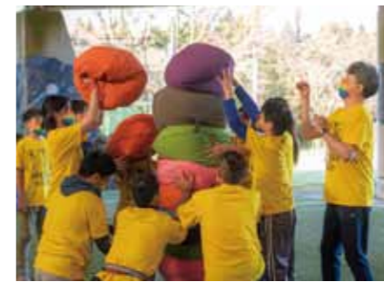
⑬こばやし熱中運動会 (南校区まちづくり協議会)