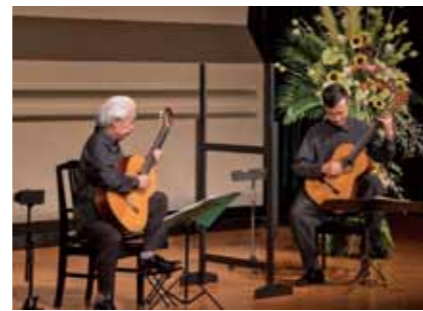
①大萩康司凱旋リサイタル (大萩康司コンサート実行委員会)