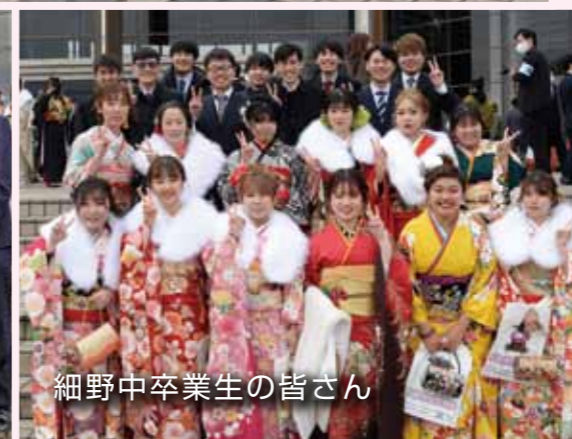
細野中卒業生の皆さん