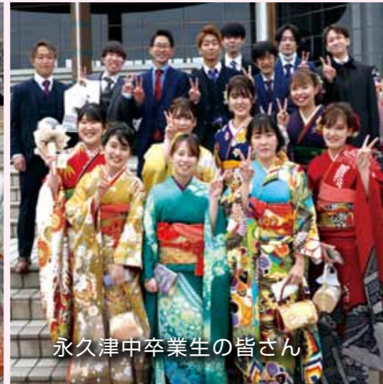
永久津中卒業生の皆さん