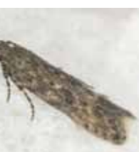
葉の食害（大きなエカキ）