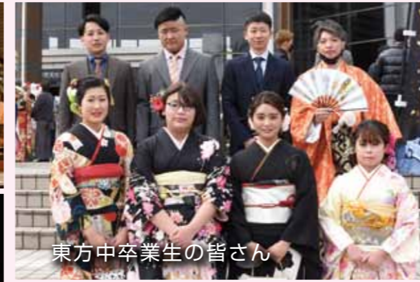
東方中卒業生の皆さん