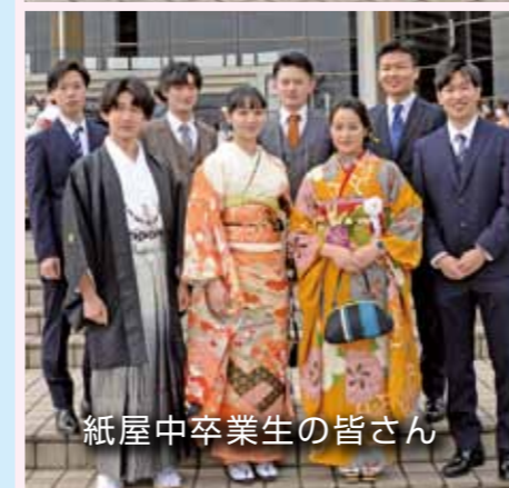
紙屋中卒業生の皆さん