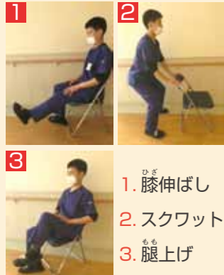
【写真】身体活動の例

厚生労働省は健康寿命を延ばすために+10(プラステン)を推奨しています。+10とは、現在の生活に10分間の身体活動を取り入れることです。普段から元気に体を動かすことで、糖尿病や心臓病、脳卒中やがんなどのリスクを下げるすることができます。生活に支障が出ない程度で無理のない活動を取り入れ継続することが大切です。