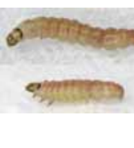
果実の食害（幼虫の侵入）