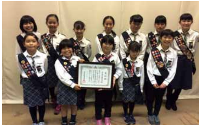
同団は自己研さんや地域貢献活動をとおして、自ら考え行動できる人材育成を行っており、その活動や団体の団結力などが評価されての受賞となりました