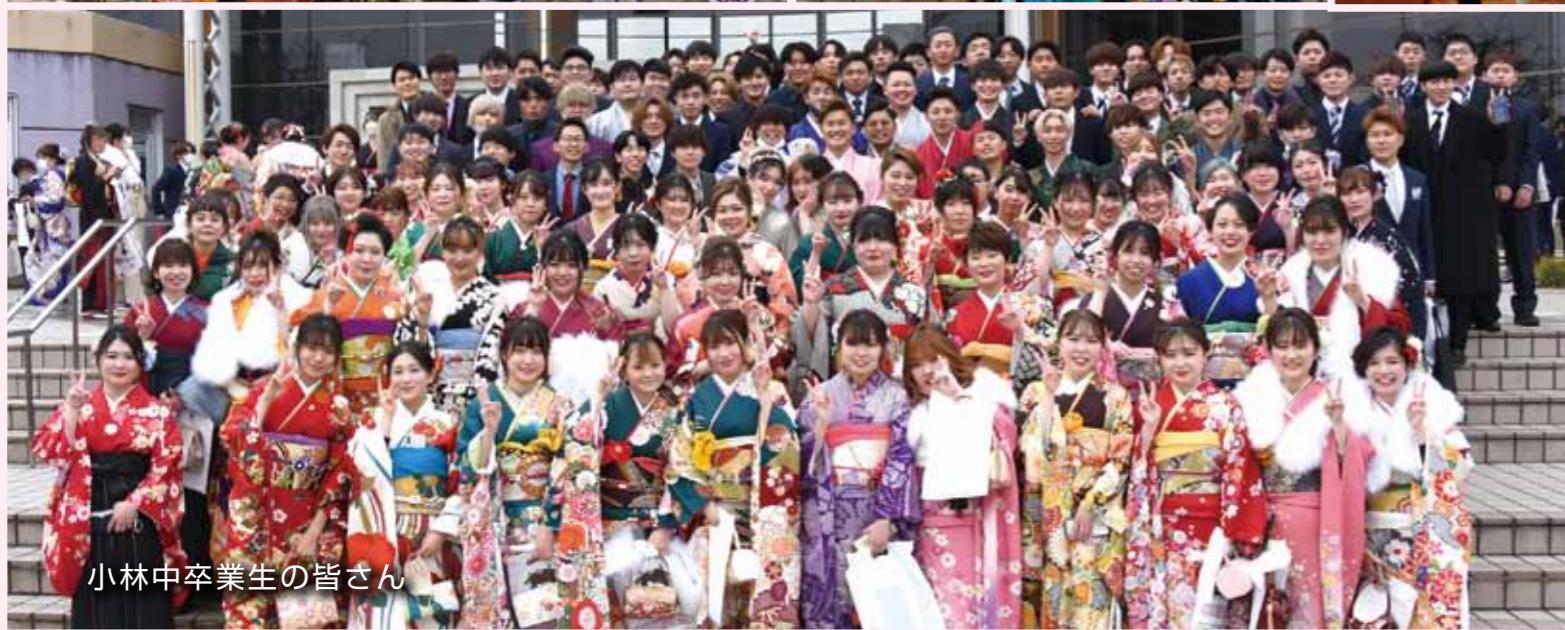
小林中卒業生の皆さん