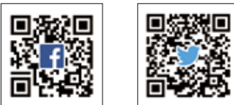
「よかとこ小林市」で検索

公式フェイスブック・ツイッター『よかとこ小林市』でも、まちの話題や役立つ情報を発信中!