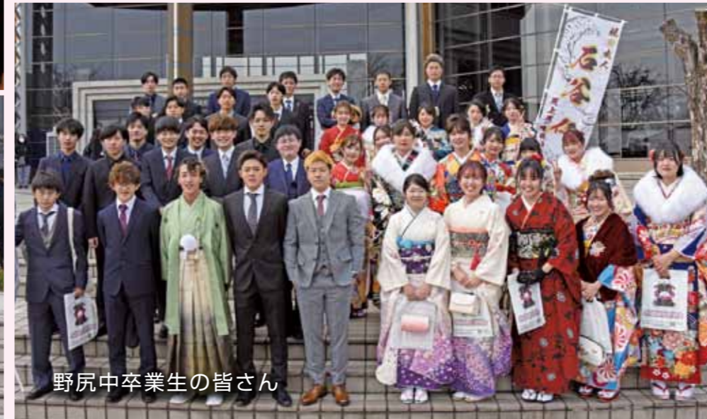
野尻中卒業生の皆さん