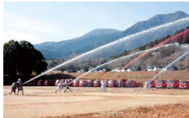
式の最後に行われた一斉放水では代表となった4つの部が、新春の空に4色の水を放水し、令和4年の消防団活動の始まりを告げました

1月9日、令和4年消防団出初式が訓練広場で行われました。当日は感染症対策のため、例年より人数を制限して開催。勤務成績優秀者に贈られる県知事表彰をはじめ、各種表彰があったのち、市長から「複雑かつ多様化する大規模災害に備え、奉仕的消防精神を堅持し、一層の精進をお願いします」と団員への訓示がありました。