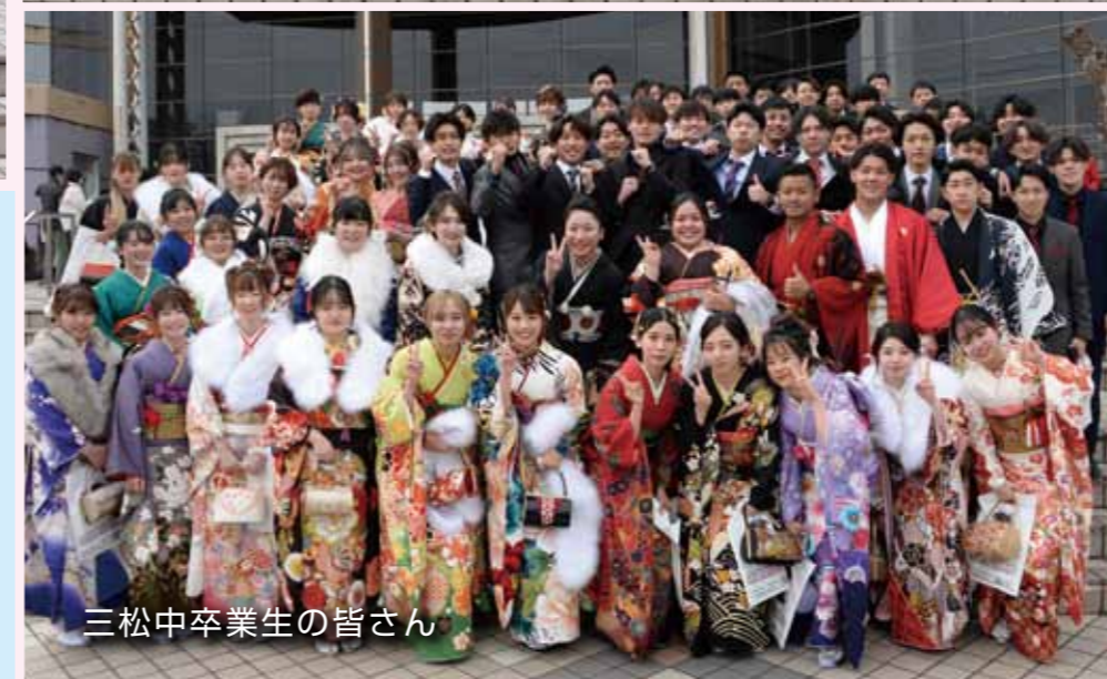
三松中卒業生の皆さん