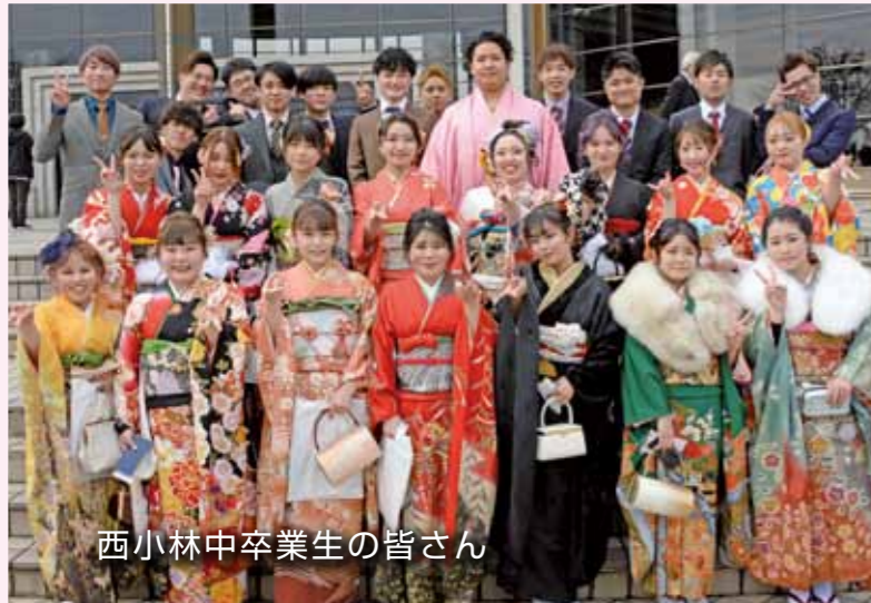
西小林中卒業生の皆さん